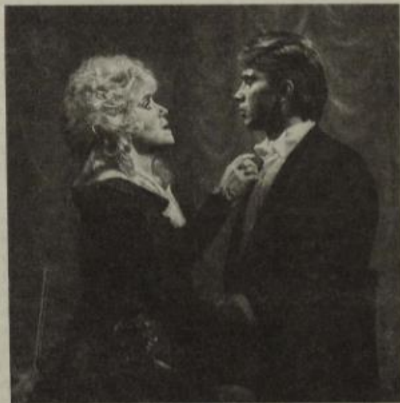
Н. Троицкая и Д. Хворостовский

Что же мне хотелось бы сказать о нем? Что поддерживать в его творчестве, от чего предостеречь? Природа одарила Хворостовского великолепным голосом — лирическим баритоном красивого тембра и полного диапазо-