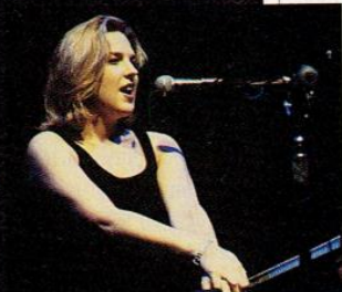
PIANO WOMAN: The young singer calls Cole her King