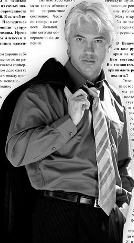
Быть поклонницей Дмитрия Хворостовского легко и приятно — он талантлив, хорош собой и трудолюбив