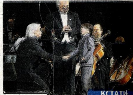
Атмосфера концерта всегда уникальна и неповторима.