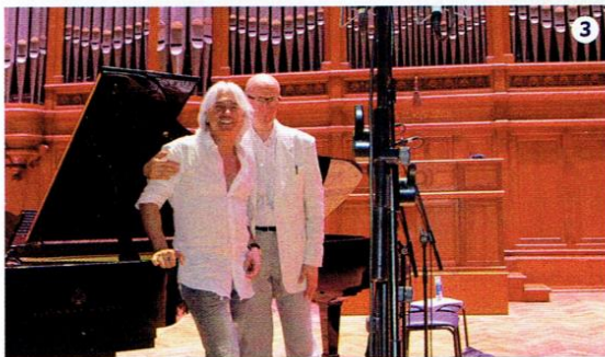
1 Dmitri Hvorostovsky and the team enjoy a casual moment waiting for the renovators at the Moscow Conservatory to finish work