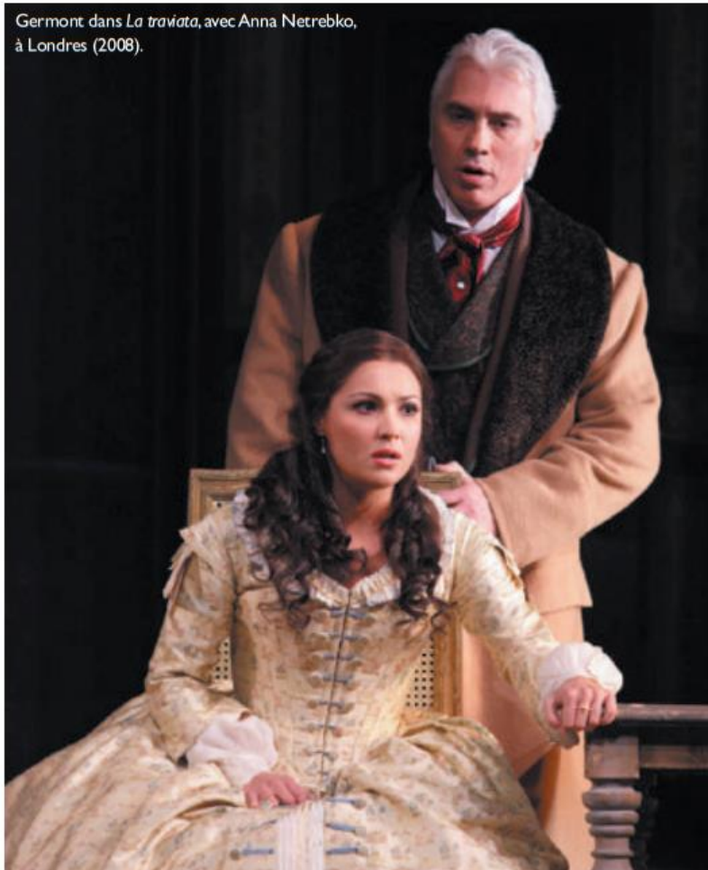
Germont dans La traviata , avec Anna Netrebko, à Londres (2008).