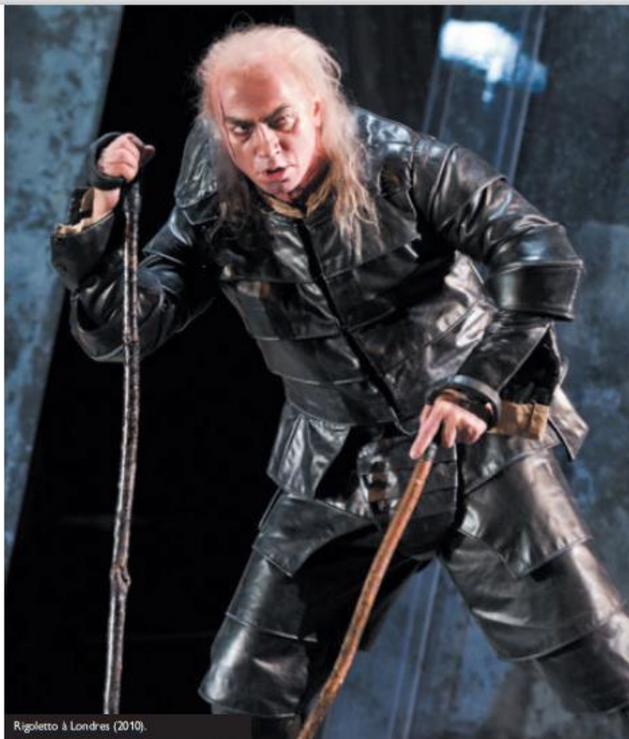
Rigoletto à Londres (2010).

Franchement, je ne vois pas où est le problème, si c'est là le moyen de toucher plus de gens. Prenez Dietrich Fischer-Dieskau, qui vient de disparaître. C'était évidemment un géant, nul ne dira le contraire ; et pourtant, par rapport à une star