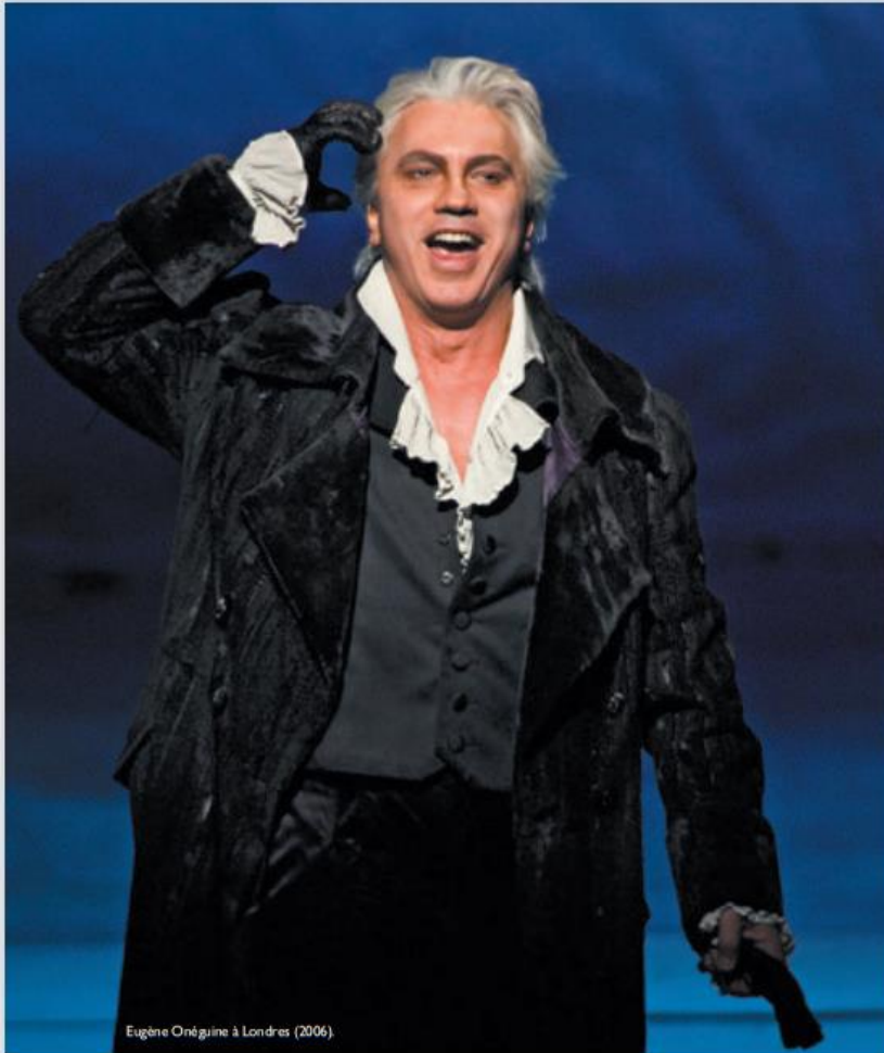
Eugène Onéguine à Londres (2006)