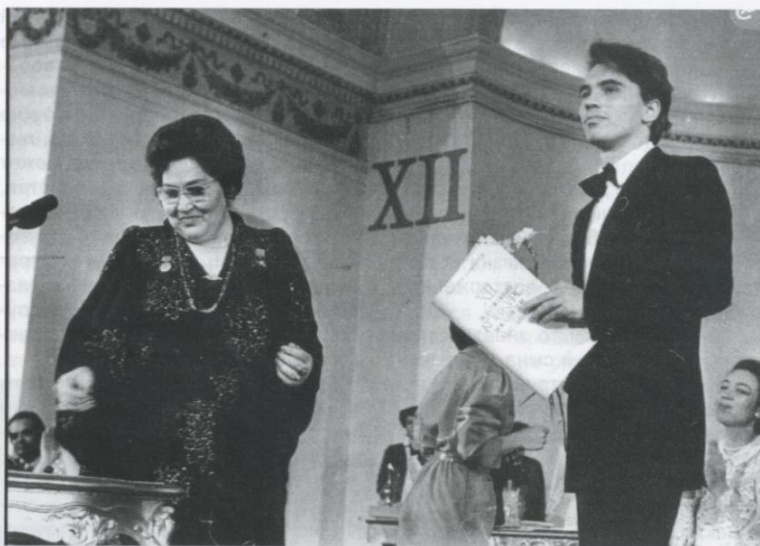
Ирина Архипова и Дмитрий Хворостовский (первая премия) – Всесоюзный конкурс вокалистов имени М.И. Глинки. Баку. 1987 год