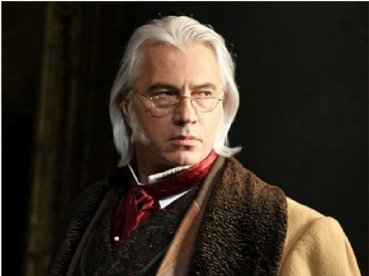
Dmitri Hvorostovsky.

“What happened yesterday was pure improvisation,” he said. “I had no rehearsal whatsoever with Ailyn Pérez [Violetta] and Stephen Costello [Alfredo]. The performance was the first time I sang with them. But all my experiences with Germont allowed me to feel free and to improvise everything I did on stage - to bring my own mastery of the role to the performance. I really loved it.” Dmitri Hvorostovsky was 27 when he won the BBC Cardiff Singer of the World competition in 1989. Four years later, he made his American operatic debut at Chicago’s Lyric Opera in the role of Germont. In September, he will perform it at the Paris National Opera and again in December at the Vienna State Opera. This role of Alfredo Germont’s father - sometimes referred to as “the elderly Germont” - is likely to stay in his repertoire for a long time to come. (American baritone Robert Merrill sang it at the Met over a period of thirty-one years.) The part contains one of Verdi’s most beautiful arias, “Di Provenza il mar”, and includes climactic High G-flats that challenge every baritone at any age. I asked Dmitri what he notices about his voice in relationship to a role he has been performing since 1993. He laughed.