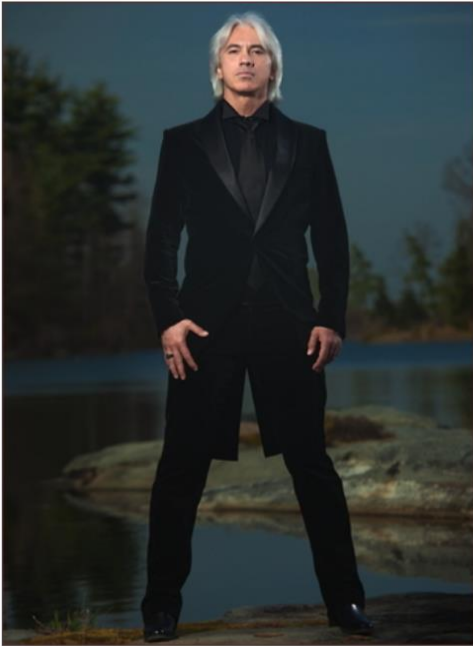
Dmitri Hvorostovsky.

them into a one_man-show. It is absolutely a theatrical piece which I present on stage. Therefore, I hope the audience will be so drawn into the drama - along with the text and the music - that they will forget they are at a recital. The music itself talks. It is nuanced with bright and sometimes very dark images. The language of Shostakovich is very clear, strong, and at the same time vulnerable. The cycle shows everything - the strain, the power, the wisdom, and the vulnerability of Michelangelo.”