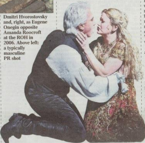
Dmitri Hvorostovsky and, right, as Eugene Onegin opposite Amanda Roocroft at the ROH in 2006. Above left: a typically masculine PR shot

Un ballo in maschera is at the Royal Opera House, WC2, from Dec 18. Box office: 020 7304 4000. The Bells of Dawn is out now on Ondine