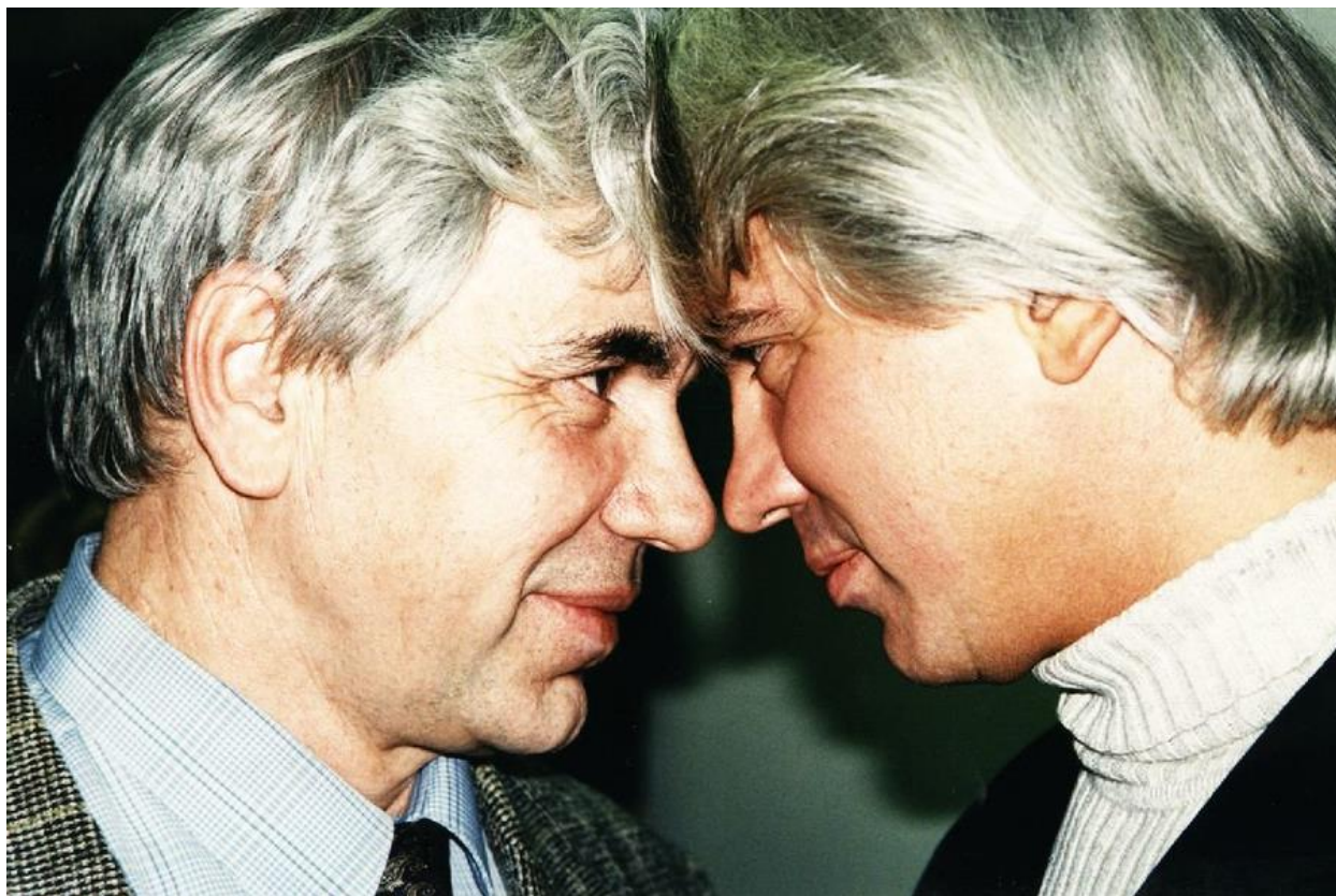
Отец и сын Хворостовские.