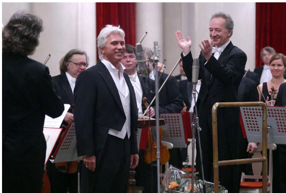
Хворостовский и Темирканов на концерте в Петербургской филармонии.

«Я сибиряк, и сибиряком остаюсь, поскольку в Сибири жил до 27 лет. И конечно, я сложился как личность в Сибири и несу какие-то черты характера, присущие именно сибиряку, — говорил артист в интервью. — Страны и параллели в моей жизни меняются одна за другой. Но мои чувства и память отданы Красноярску, где у меня есть любимые места, живут любимые люди».