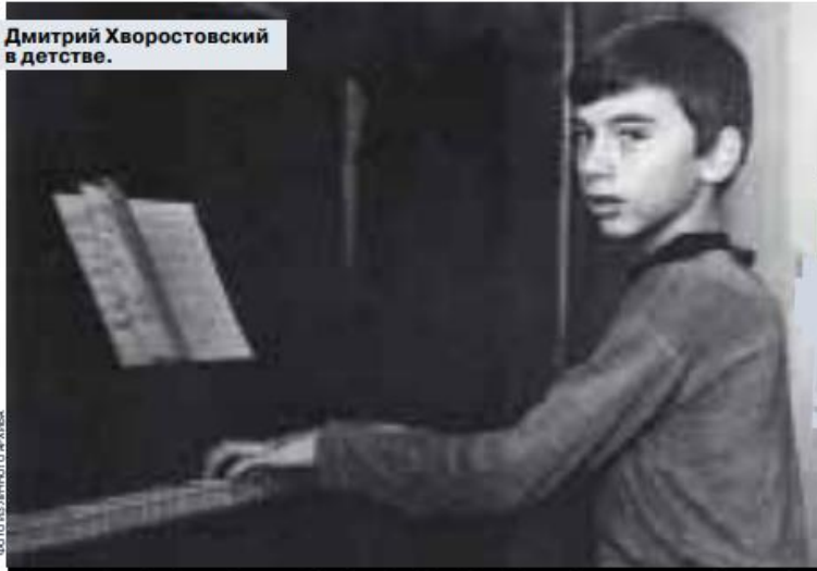
Дмитрий Хворостовский в детстве.