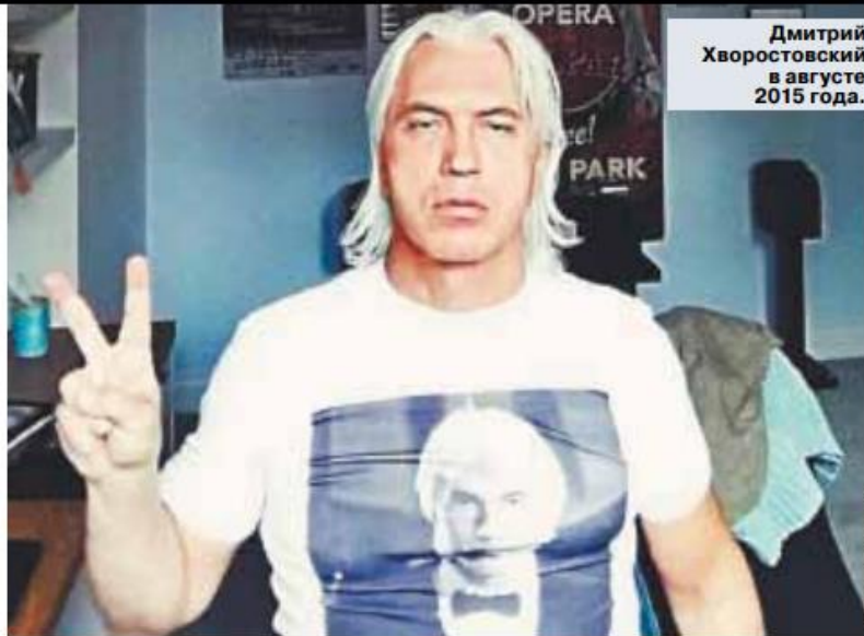
Дмитрий Хворостовский в августе 2015 года.