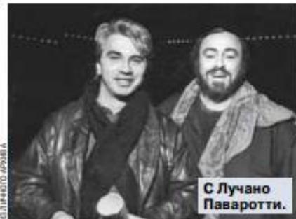
С Лучано Паваротти.