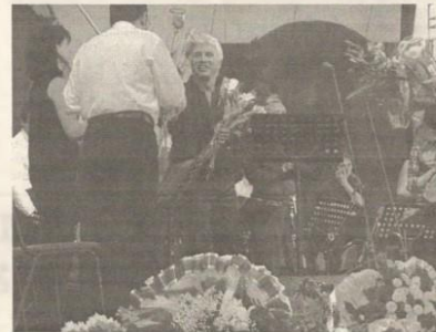
Цветы Дмитрию Хворостовскому.