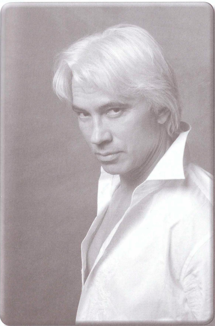
Дмитрий Хворостовский 10 ноября 2008