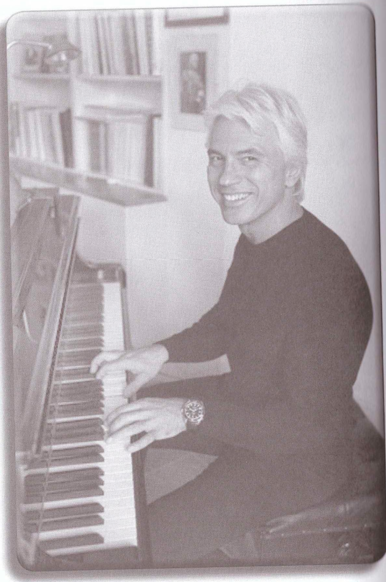
Д. Хворостовский. Лондон, 2008