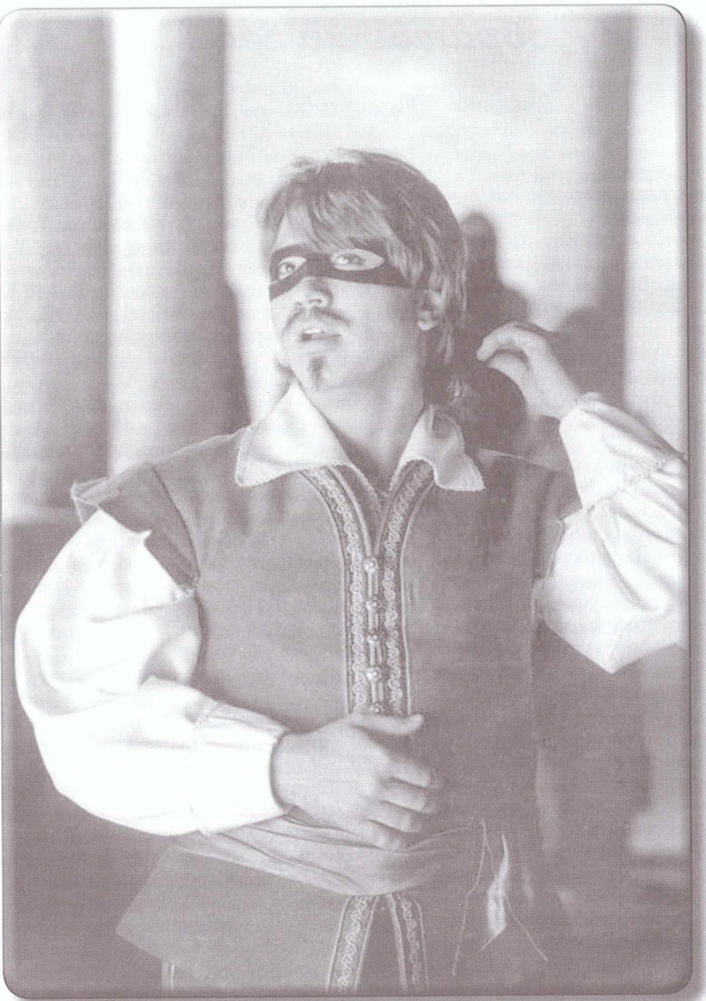
Сцена из кинофильма «Дон-Жуан». 1999