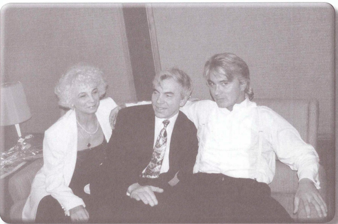
Д. Хворостовский с родителями Ленинград. 1995