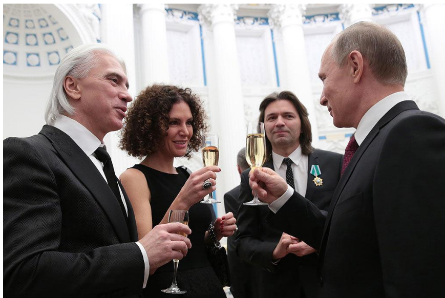
Хворостовский был заслуженным артистом РСФСР и народным артистом России, кавалером ордена «За заслуги перед Отечеством» IV степени. На фото с супругой Флоранс, певцом Дмитрием Маликовым и президентом России Владимиром Путиным (слева направо) после церемонии вручения государственных наград в Кремле, 2015 г.