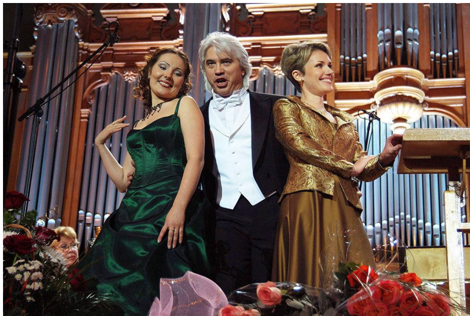
Мировой успех пришел к певцу с победой в Международном конкурсе оперных певцов в Кардиффе в 1989 г. На фото со звездными коллегами Екатериной Сюриной и Мариной Домашенко в Большом зале Московской консерватории, 2003 год.