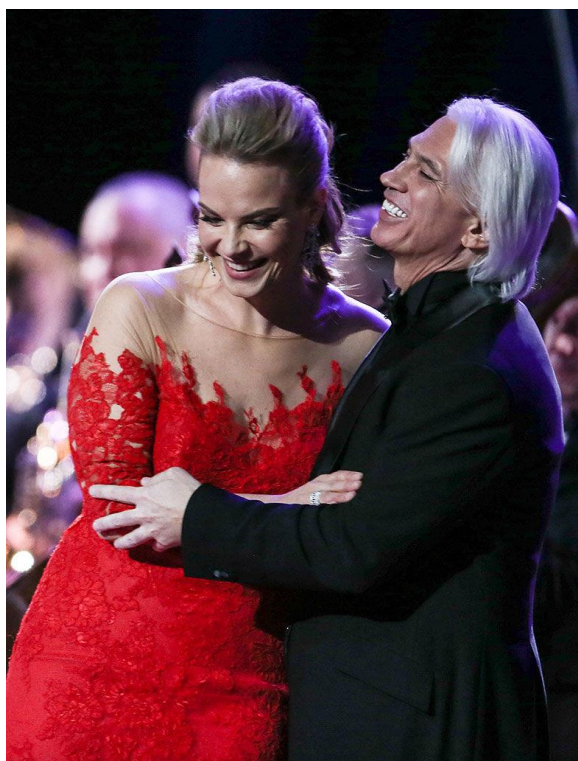
Знаменитый баритон оперного певца звучал в лондонском «Ковент-Гардене», Баварской государственной опере, Берлинской государственной опере, миланской «Ла Скала», Венской государственной опере, нью-йоркской «Метрополитен-опере», Мариинском театре и других театрах. На фото с латвийской певицей Элиной Гаранча на концерте из цикла «Хворостовский и друзья» в Государственном Кремлевском дворце, 2015 г.