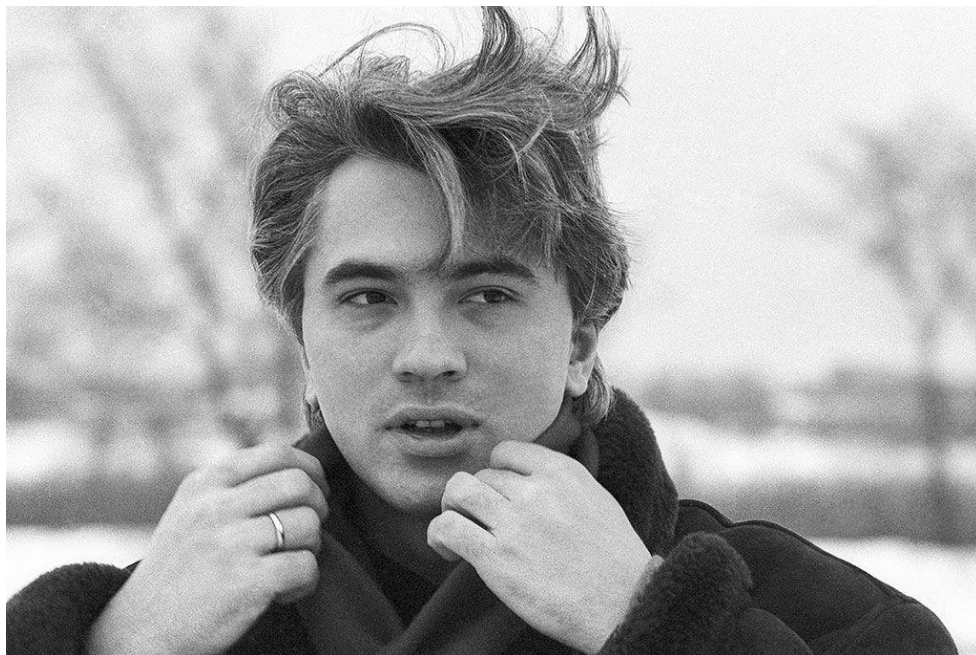
Дмитрий Хворостовский во время съемок видеофильма «Звезда из Сибири», Красноярск, 1992 г.