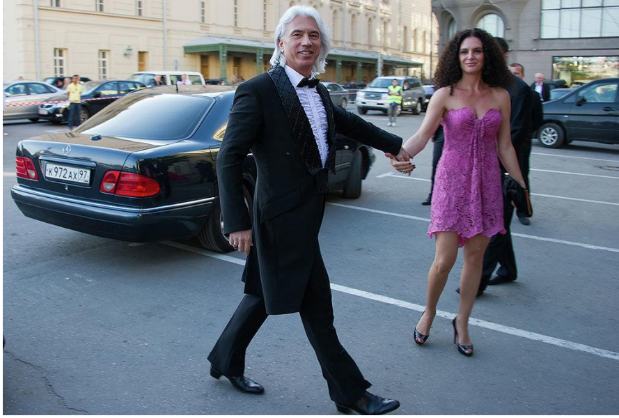
В репертуаре певца были партии в операх «Севильский цирюльник» Джоаккино Россини, «Травиата» Джузеппе Верди, «Иоланта» Петра Чайковского, а также романсы и песни военных лет. На фото с супругой, 2011 г.