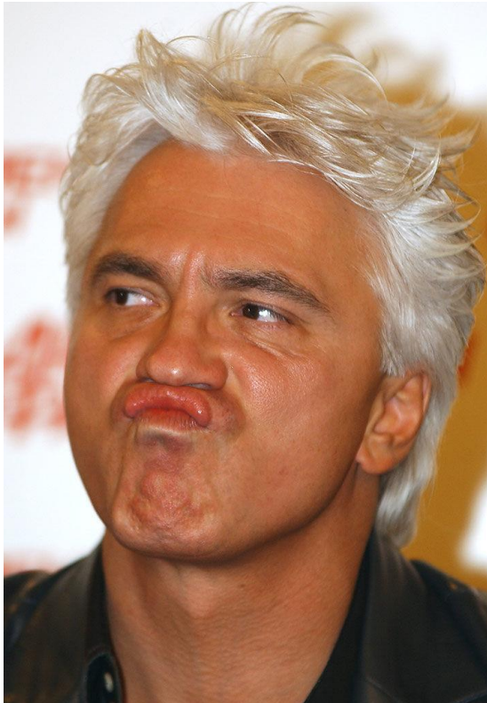
Хворостовский окончил музыкальное отделение Красноярского педагогического училища и вокальный факультет Красноярского государственного института искусств, фото 2006 г.