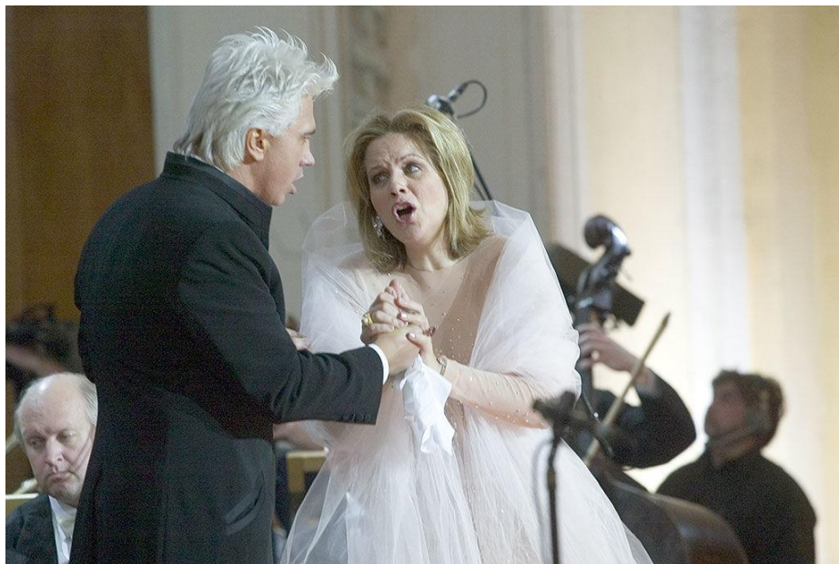
2006 г. первый концерт из серии «Хворостовский и друзья» - со звездой американской оперы Рене Флеминг.