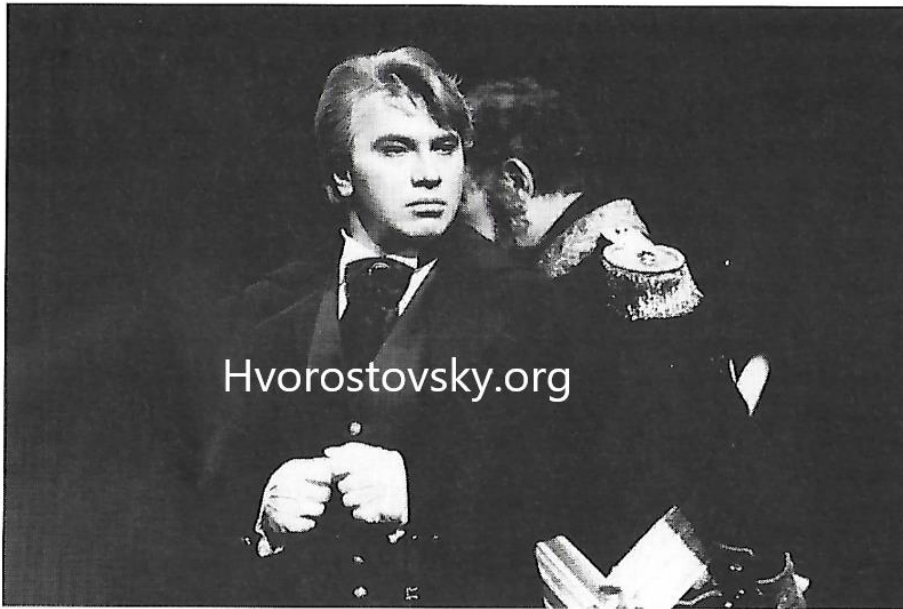
● Hvorostovsky as Onegin at Covent Garden, 1993

New York's Alice Tully Hall. His operatic debut in the West took place in Nice in 1991 as Yeletsky. Covent Garden first heard him in 1992 as Riccardo in I puritani , with his American opera debut following a year later in Chicago as Germont. His career's centre of gravity having shifted west, he took an apartment in London in 1994. With so much coming so fast, it was probably inevitable that not everything went as well as it might have. 'When I was young, I thought I could do anything. Now I am wiser,' he says with a characteristic forthrightness that makes even his comments on the beauty of his voice seem natural and unassuming. But if some performances lacked a sharp artistic profile—his 1996 Salzburg debut as the Count perhaps being one—he never made rash decisions that might have imperilled the voice itself. In conversation, one comes to appreciate his understanding of what his voice can do and how its development will permit different things in the future.