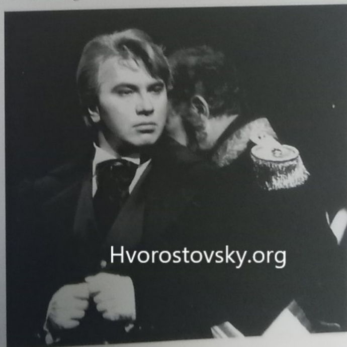
■ As Onegin at Covent Garden in 1993